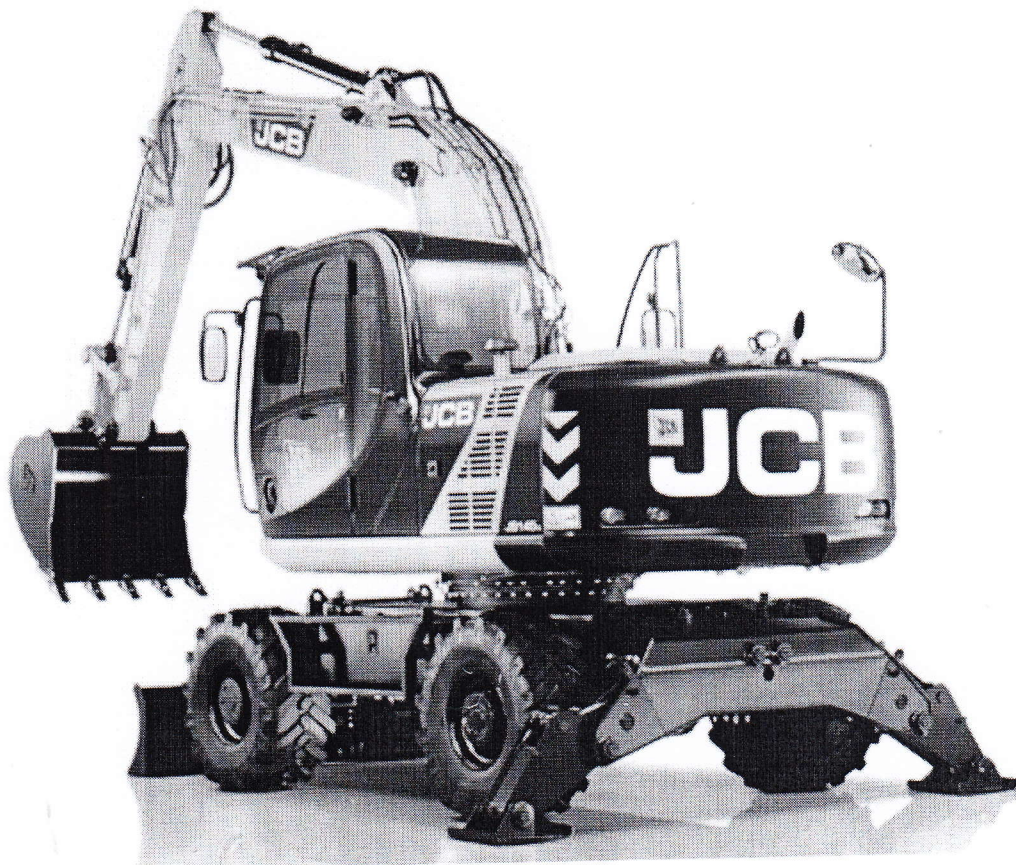
Экскаватор на колесном ходу JS160W

Как официальный представитель компании JCB – Англия на территории Украины, предлагаем Вашему вниманию следующую строительную технику: